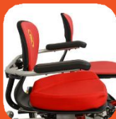
Flyttbar stol och extra tjock dyna