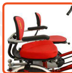
Ställbar stol och extra dyna