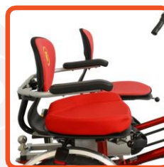
Ställbar stol och extra dyna